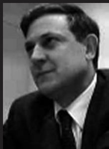
F. Iribarren Fentanes Ekonomia eta Ogasun Kontseilaria 7 kargu