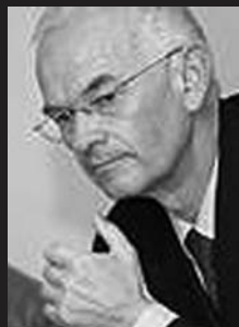
J.J. Echarte Echarte Nekazaritza, Abeltzaintza eta Elikadura Kontseilaria 6 kargu